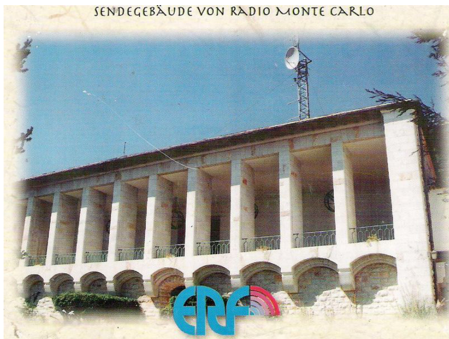
SENDEGEBÄUDE VON RADIO MONTE CARLO

In den besten Zeiten sendete TWR Monte Carlo über drei Kurzwellensender und einen leistungsfähigen Mittelwellensender aus Monte Carlo oder genauer eben von einem französischen Sendegelände in direkter Nachbarschaft. Studios und Büros waren aber tatsächlich in Monte Carlo, was für manchen spendenfinanzierten Missionar angesichts der Lebenshaltungskosten auch ein Problem war. Deshalb begann in den achtziger Jahren ein Exodus. 1985 beispielsweise wurde die europäische TWR-Zentrale in die Niederlande verlegt, 1987 die russische Abteilung zum ERF nach Deutschland. Auch hinsichtlich der Kooperation mit Radio Monte Carlo wurden die Bindungen gelockert. Als RMC in