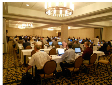
Blick in den Konferenzsaal der HFCC-Planungskonferenz für das Winterhalbjahr 2011/12

legten Frequenzen 216 kHz (RMC) und 1467 kHz (TWR spätabends) (Dr. Hansjörg Biener)